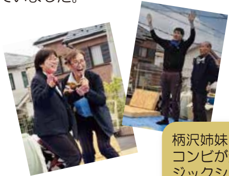
柄沢姉妹&芸人志望コンビが登場したマジックショー。