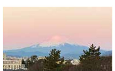
高齢者住宅一番館の窓から見える朝焼けの富士山。空気が澄んでいるのでとてもきれいに見えます。

ぐるーぷ藤一番館から見える富士山は四季折々の表情を見せてくれます。施設内はいつも適温に保たれ守られた環境ですが、元旦の富士山は背筋がピンとするような神々しさと自然の寒さを伝えてくれました。白息（しらいき）をおもしろみ、霜柱を踏みながら歩んだ通学路や痛痒いしもやけを、懐かしく思い出される方もいらっしゃるでしょう。2024年空気が最もきれいな国ランキング27位の日本ですが、冬の朝の澄んだ空気で深呼吸してみてください。