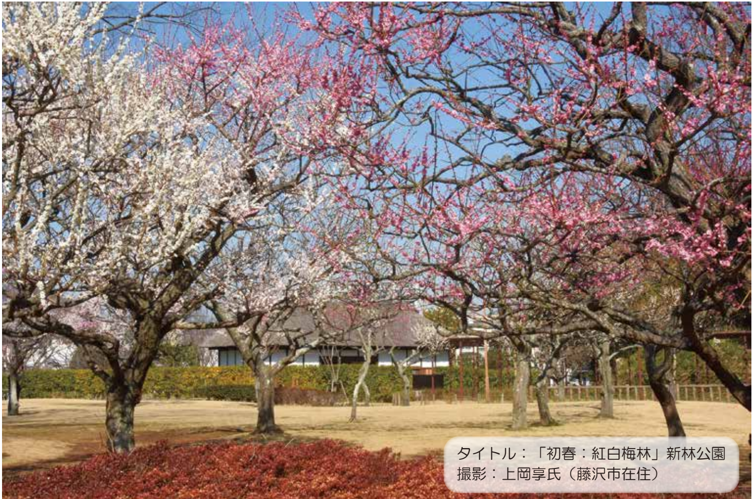
タイトル：「初春：紅白梅林」新林公園 撮影：上岡享氏（藤沢市在住）

上岡氏は「ヨロシク♪まるだい」で活動してくださっている「まるだい写真展示同好会」6名のうちのお一人です。新林公園の紅白梅は咲き揃うのは珍しく、普段は時間差で咲くそうです。共に見頃を迎える紅白梅の写真もなかなか美しく瑞兆かと思われます。