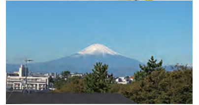
一番館4階の窓から撮影

一気に秋が深まりましたね。一番館の皆様もようやく外のお散歩を楽しまれるようになりました。高齢者住宅の窓からは富士山もくっきりと見えるようになってきました。この季節