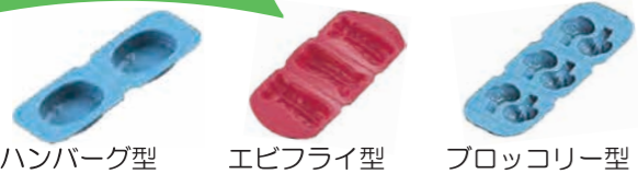
ハンバーグ型 エビフライ型 ブロッコリー型