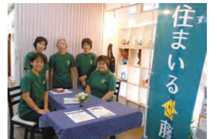
相談員がお待ちしております。