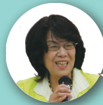
衆議院議員 阿部知子氏

DV、虐待等 痛ましい事件が続き家族 が家庭が壊れている。藤の ようなNPOが地域を支えて くれることが心強い。日本の トップランナーとして福祉の あり方を行政に伝える立場 になってほしい。