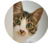
1階全室専用庭付き (小型ペット飼育可)