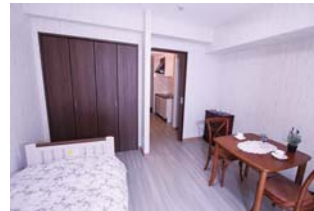
使いやすい重視の居室 高齢者のための