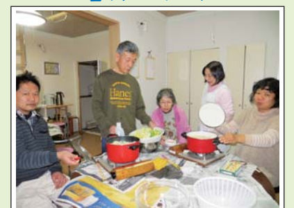
ホームの皆さんの自炊の練習として はじまった料理サークルですが、 今では段取り、調理もバッチリ！