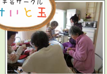
障がいがある方と地域の方が いっしょに、編み物や小ものづくり等の 創作活動をしています。