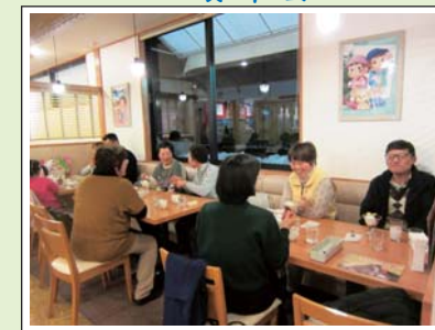
ボランティアすみのれの方々と いっしょに、月1回、レストランでの 食事を楽しめます。 また、忘年会は、ホームの皆さんが 腕をふるってのシチューパーティ開催が 恒例になっています。