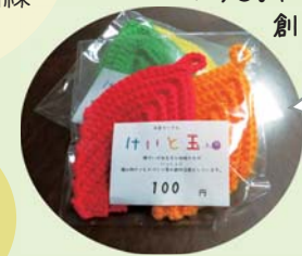
こちらは アクリルたわし。 洗剤いらずで 洗い物スッキリ！