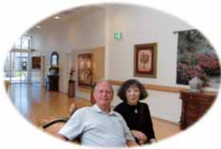
サザンクロスケア・クィーンズランド視察

各所で聞いた問題点として、在宅サービスが複雑で自己決定がなされていないこと、高齢化に伴い需要にサービスが追いつかないこと、ケアの大部分をボランティアが支えている、などが挙げられていました。