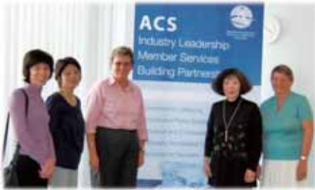
「NSW州とオーストラリア首都 特別地域で活動する高齢者ケア・コミュニティケアプロバイダーのNPO法人」の訪問

政府から補助金を受けられるため、NPO・NGOが多く、今回訪問した「ニューサウスウェルズ州社会サービス協議会」や「高齢者ケア・コミュニティケアプロバイダーのNPO法人」などは、それらの社会福祉サービスの調整・支援や地域住民に対する案内をしています。また、自分たちの意見や現状を政府に訴え、政策に反映するよう積極的な活動をしているそうです。そのパワーには驚きました。