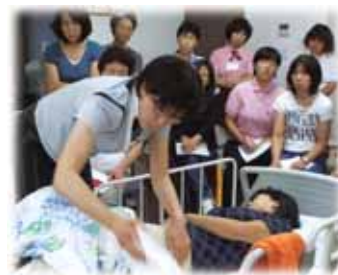
腰への負担をなくしましょう