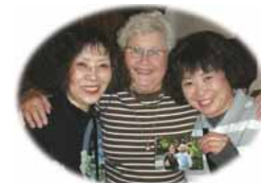
「'06 スウェーデン研修より」