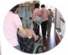
非常口・非常階段からの訓練の様子