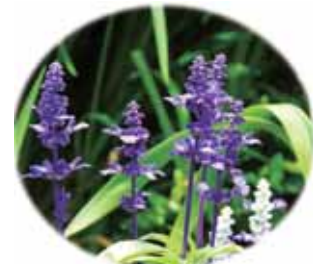
ブルーサルビア (デイハウス藤の花の庭より)