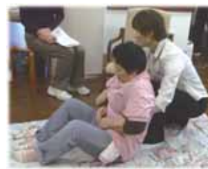
実践に即した研修の実施