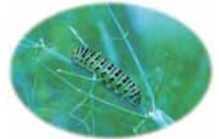
フェンネル畑の青虫ちゃん (デイハウス藤の花の庭より)