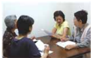
よりよいサービス提供のためのケース会議

「ぐるーぷ藤」は、介護保険がはじまる以前に“市民同士の助け合い”からはじまりました。その活動の中で地域のニーズを肌で感じ取り、市民参加型の地域福祉を実践して18年目となります。「歳をとっても病気になっても障がいがあってもいつまでも自分らしく暮らせる街を創りたい」という理念を持ち、組織作り、スタッフの能力開発、組織内外のコミュニケーションのあり方を考え、活動を進めてきました。その実績と経験が、事業所としての評価へ繋がったものと考えています。