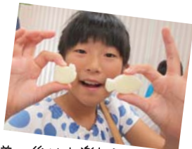
講義の後はお楽しみ 「こねこねせっけん」 「バスボム」作り。