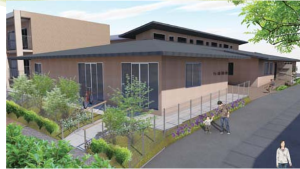
アクア棟完成予想図