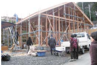
3月に完成予定の新「未希の家」