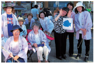
「コンフォールの夏祭り」にて。藤が岡の家では、今年も魚釣りゲームを出店。