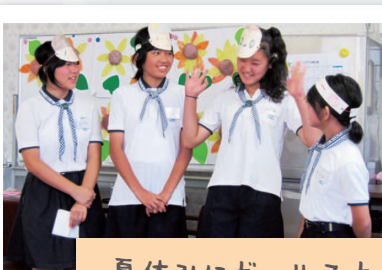
夏休みにガールスカウトの子どもたちが来てくれました。子どもたちが講師になり、手話を教えてくれました。