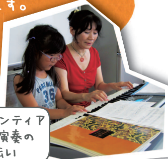
子どもボランティアもピアノ演奏のお手伝い