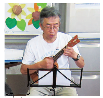
いつも来て下さる音楽ボランティアの方々。「しがらき」の中に、楽しそうな歌声が響きます。