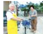
買い物が楽になりました！

東日本大震災で被災された方々に被災地の「NPO法人おひさまくらぶ」と「NPO法人ささえ愛山元」を通して自転車を22台贈りました。