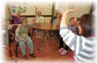
どれ、私も ゆっくり呼吸しながらね。