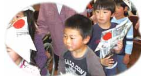
どんぐりころころの合唱で入場!!