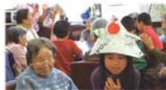
「しがらきの湯」に子どもたちが 遊びにきてくれました