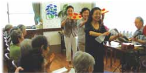
みんなで歌うと楽しいね。