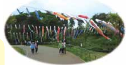
「こいのぼりがいっぱいね」