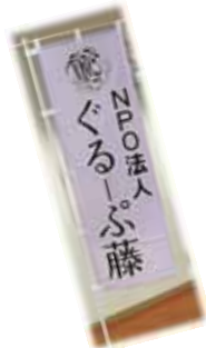
のぼり旗を作りました

「お互いさま」の気持ちを大切に。横のつながりを大切に。 新体制で、よりよいサービスをめざします。