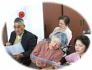
ふるさと みんなで歌ったよ！