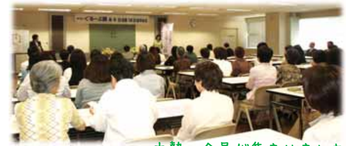
大勢の会員が集まりました