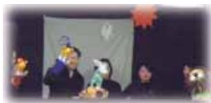
「どんぐり劇団」による 「ぐりとぐらの大掃除」