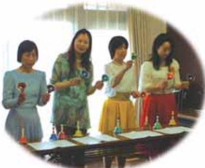
ハンドベル きれいな音色ね