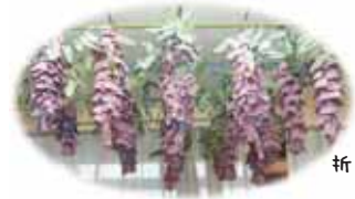
折り紙の藤の花が満開に！

これからの季節、脱水症に特に気を配っています。高齢になると体内に蓄積される水分が少なくなり、こまめな水分補給をしないとまたたく間に脱水症状を起こします。デイサービスで楽しく美味しく水分を摂取する方法をご紹介します。