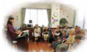
歌ってほんとに楽しいわ!!