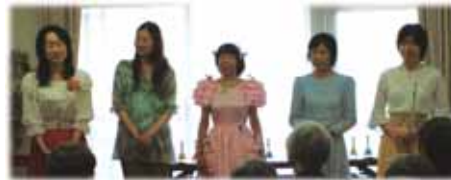
楽しい雰囲気 みんな大満足