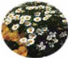
「藤の花」の庭は花盛り