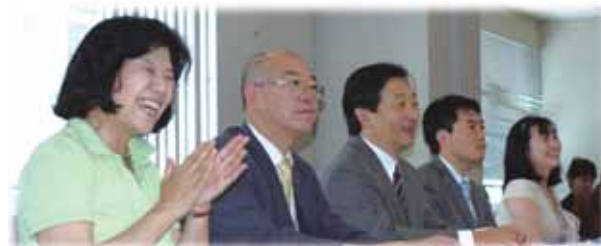
来賓の皆様 和やかな雰囲気で行われました