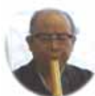
懐かしい音色 篠笛・太鼓・尺八・三味線